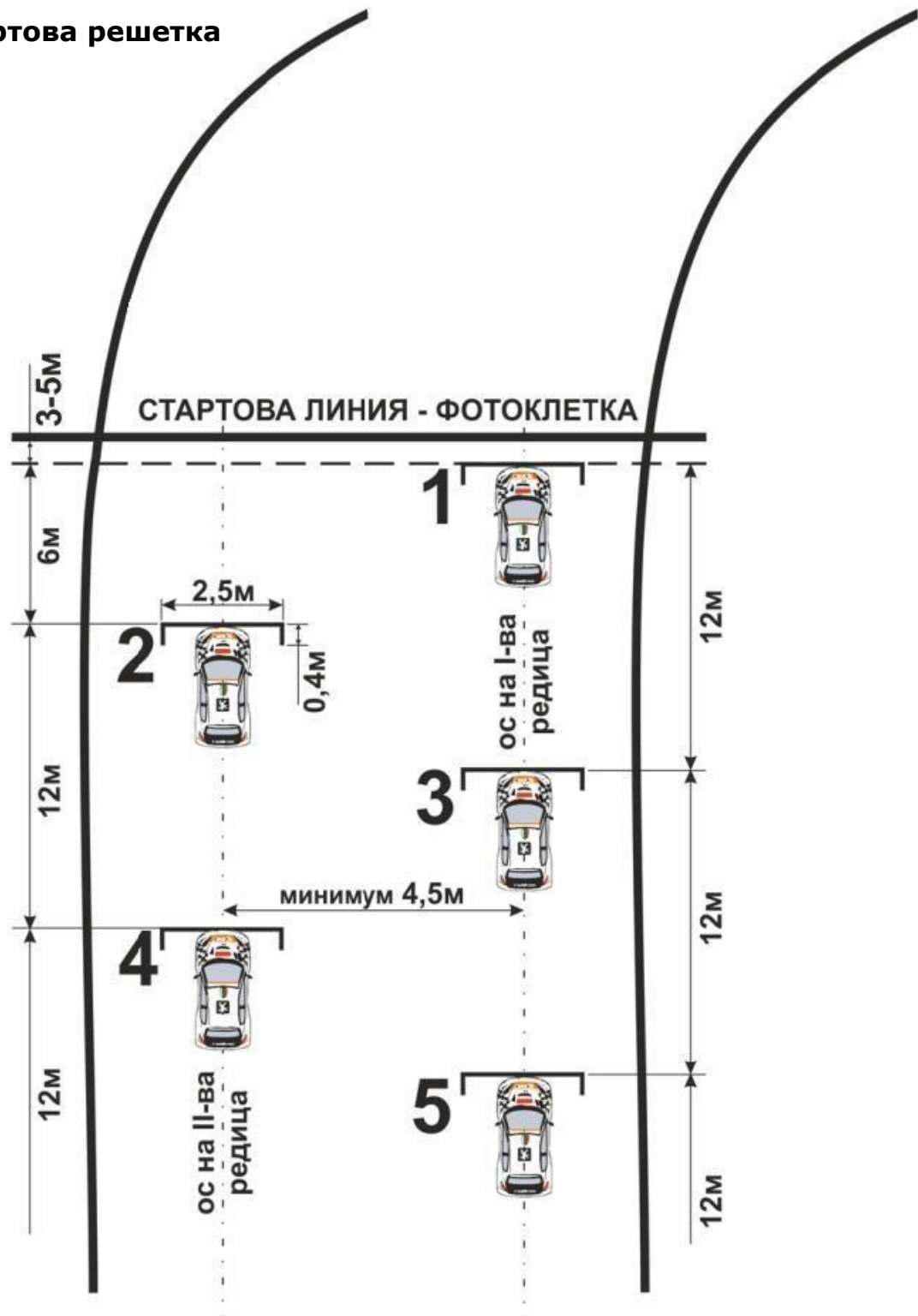
Схема на стартова решетка